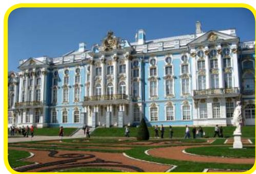
Le palais de Catherine à Pouchkine (Russie), 1752-1756.