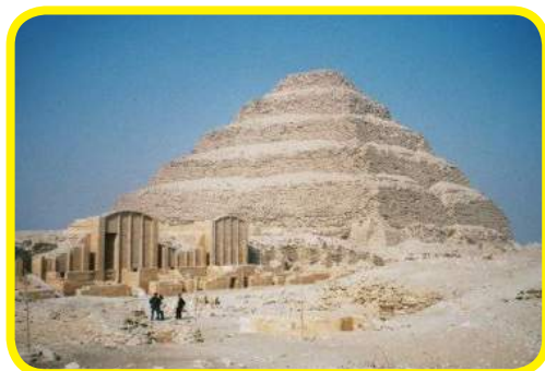
La pyramide de Djoser à Saqqarah (Égypte), vers 2600 avt JC.

Comparez le bâtiment avec les photographies suivantes et retrouvez à quel style architectural il fait référence.