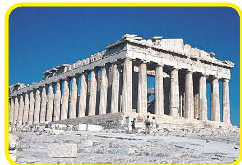
Le Parthénon à Athènes (Grèce), 447-432 avt JC.