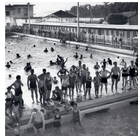
© Bibliothèque municipale de Lyon / P0546 SV 0121

Une visite ponctuée de temps dessinés pour porter un regard sensible sur notre rapport à l'eau.