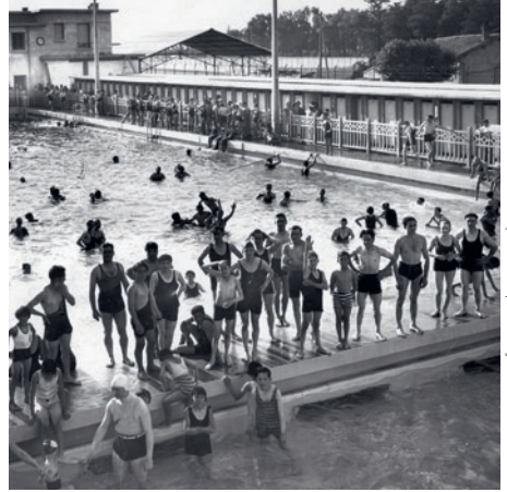
© Bibliothèque municipale de Lyon / P0546 SV 0121

Une visite ponctuée de temps dessinés pour porter un regard sensible sur notre rapport à l'eau.